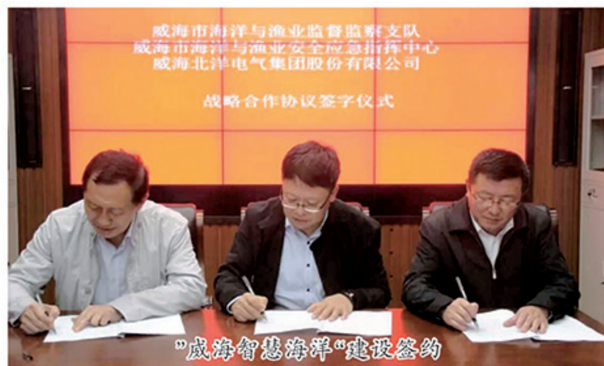
“威海智慧海洋”建设签约