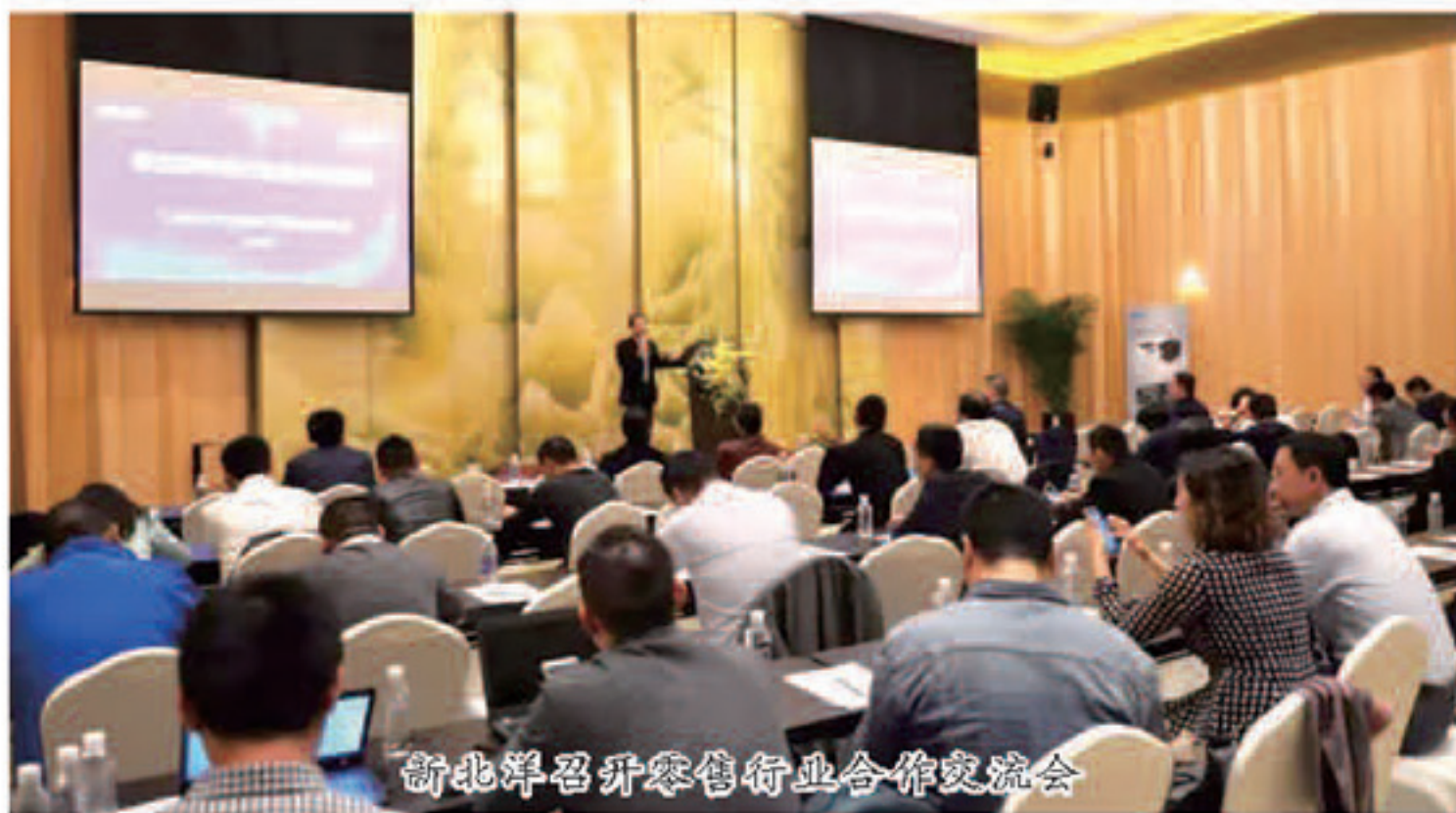
新北洋召开零售行业合作交流会

11月3日至5日,中国商业零售行业的年度盛会——第十八届中国零售业博览会在苏州国际博览中心举办,会上吸引了近700家企业参与。该展会是目前中国最大、世界第二大的零售类专业展会,在国内外零售行业中享有盛誉。新北洋作为知名的智能打印识别产品及解决方案提供商,也盛装亮相此次展会,展示了新北洋在零售行业收银管理、门店管理和仓配管理等相关业务环节的打印解决方案,并于4日下午召开了零售行业合作交流会,受到与会观众的高度关注。