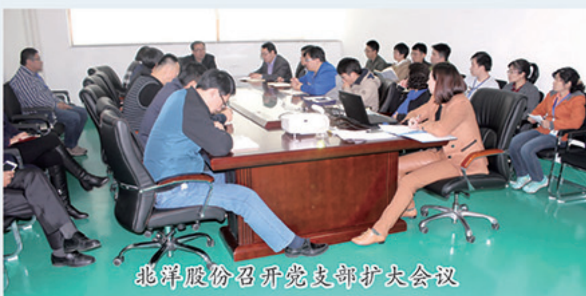
北洋股份召开党支部扩大会议

10月31日，北洋股份召开了党支部扩大会议，公司党支部书记及全体党员、办公会成员参加。会议传达了《中国共产党第十八届中央委员会第六次全体会议公报》、《习近平在全国国有企业党的建设工作会议上的讲话精神》及市委组织部常务副部长、国企工委书记于东海、威海市国有资产管理办公室主任李峰讲话精神，总结了公司党支部建设情况，并部署了下一步工作。